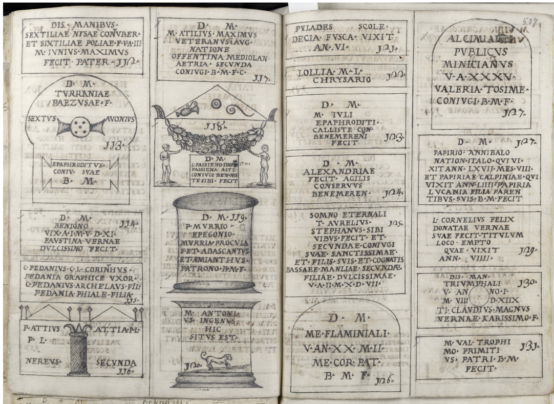
Fig. 2) BMF, ms. A 6, cc. 506v-507r.