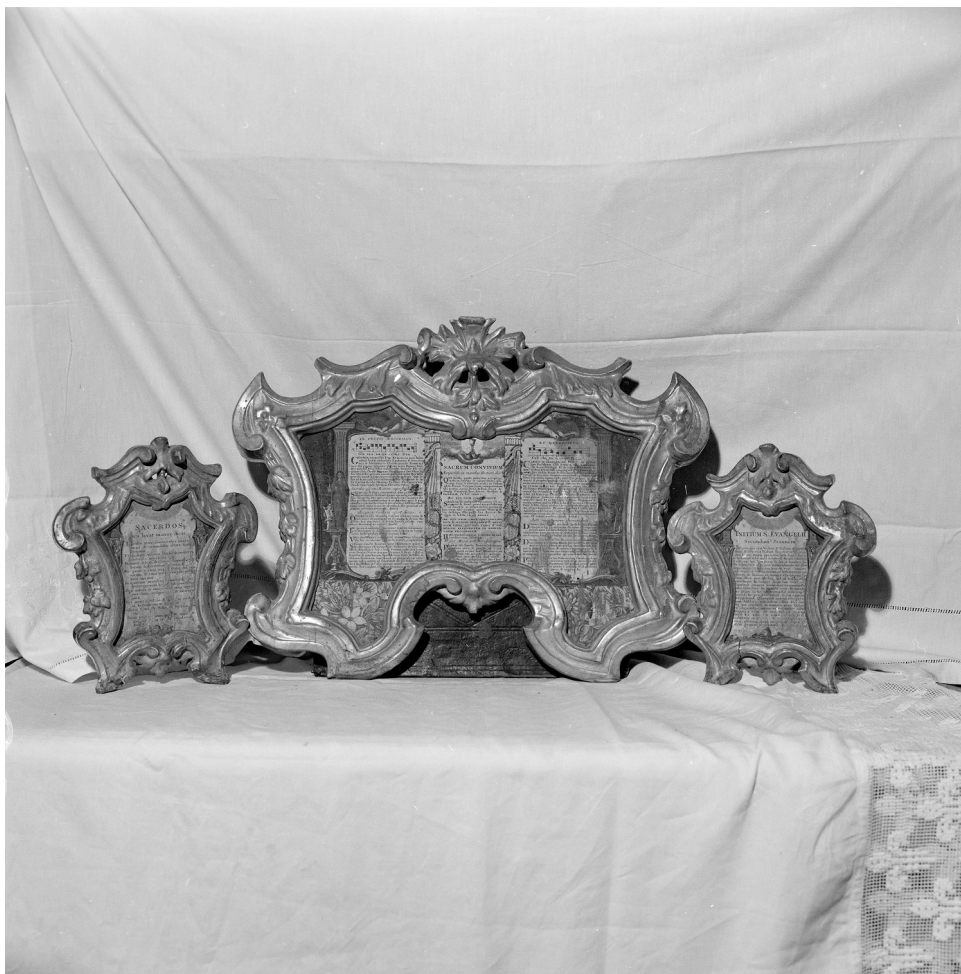
Fig. 12) Anonimo del XVIII secolo, Cartagloria , Firenze, Gallerie degli Uffizi, catalogo generale delle Soprintendenza Archeologia, Belle Arti e Paesaggio per la città metropolitana di Firenze e le province di Pistoia e Prato n° 09 00033316.