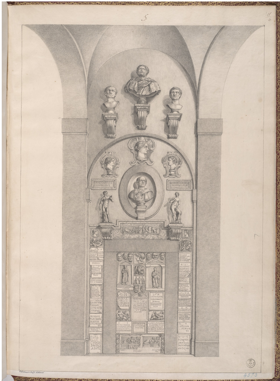
Fig. 6) Filidoro Rossi, Galleria degli Uffizi, Parete del Ricetto , Firenze, GDSU, inv. 4573 F.