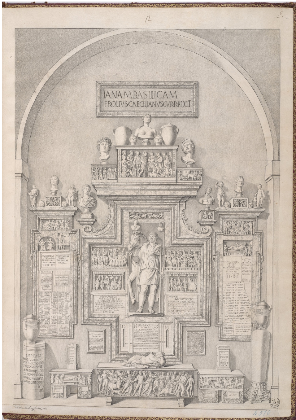
Fig. 4) Tommaso Arrighetti, Galleria degli Uffizi, Parete del Ricetto , Firenze, GDSU, inv. 4570 F.