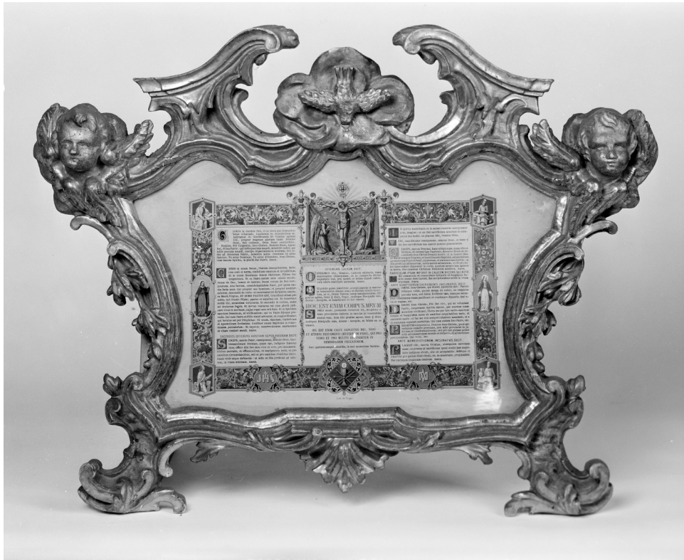
Fig. 11) Anonimo fiorentino tra 1725 e 1749, Cartagloria , Firenze, Gallerie degli Uffizi, catalogo generale delle Soprintendenza Archeologia, Belle Arti e Paesaggio per la città metropolitana di Firenze e le province di Pistoia e Prato n° 09 00339627.