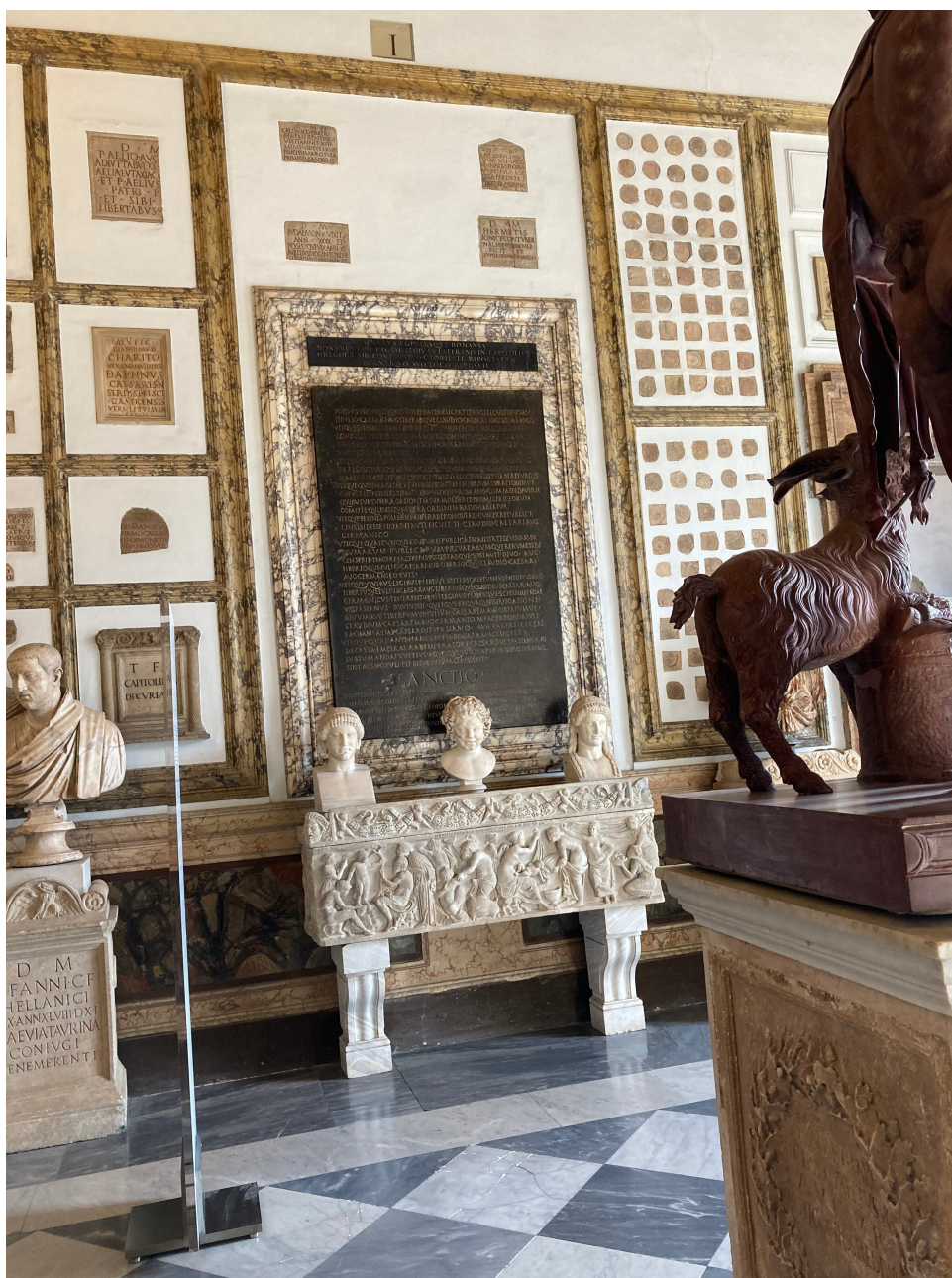
Fig. 15) Lex de Imperio Vespasiani , Roma, Musei Capitolini, Sala del Fauno.