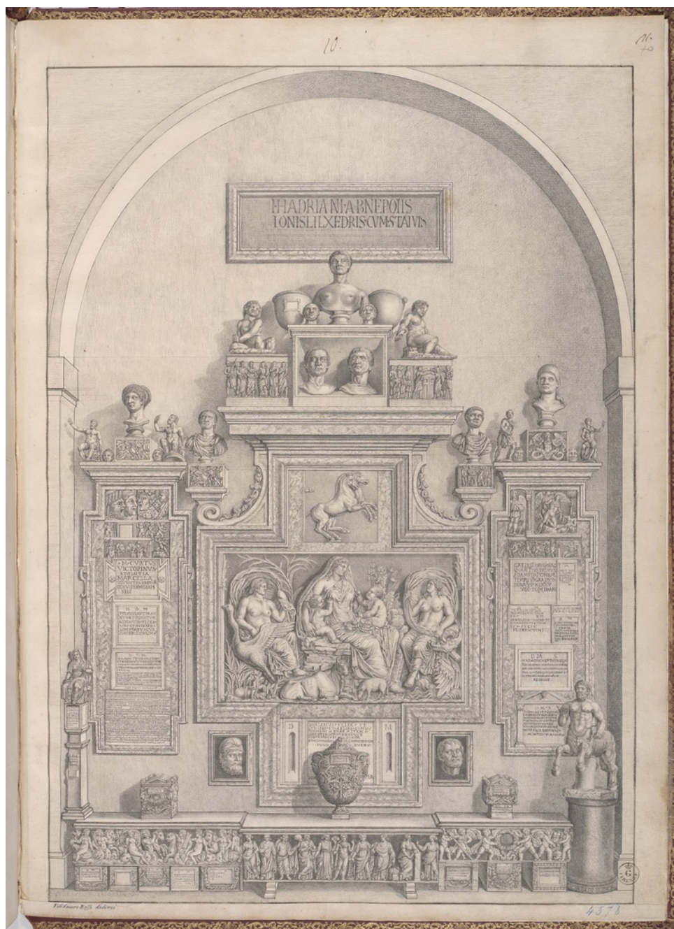
Fig. 3) Filidauro Rossi, Galleria degli Uffizi, Parete del Ricetto , Firenze, GDSU, inv. 4578 F.