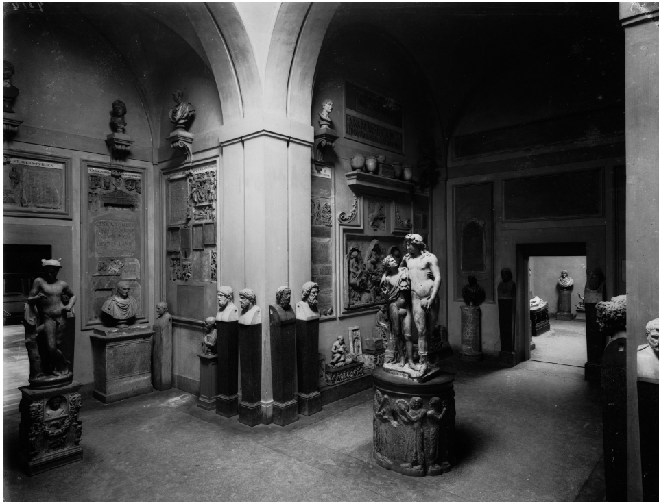
Fig. 2), Interno della Sala delle Iscrizioni nella Galleria degli Uffizi, 1890-1910 ca., Firenze