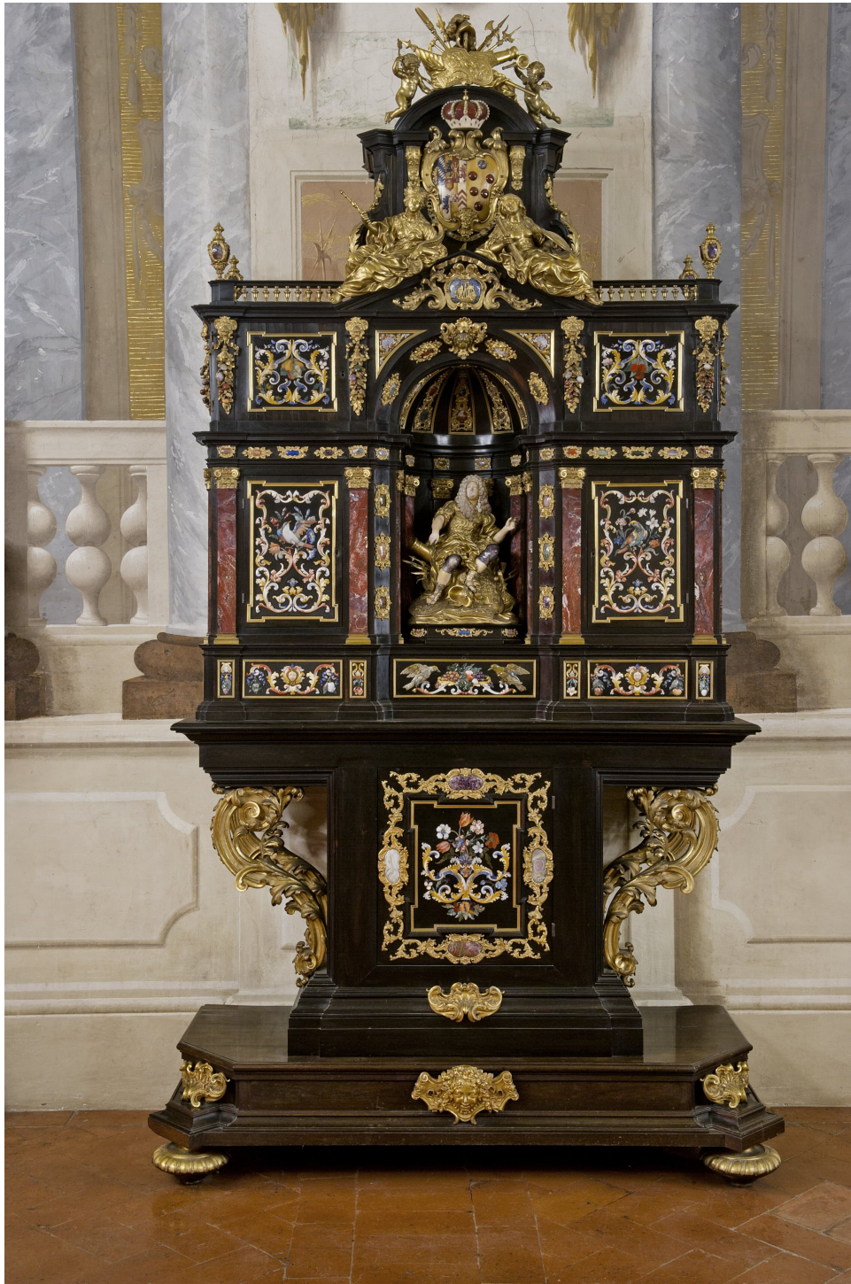
Fig. 5) Giovanni Battista Foggini, Stipo dell'Elettore Palatino , Firenze, Palazzo Pitti, Tesoro dei Granduchi, inv. OA 1911, n. 909.