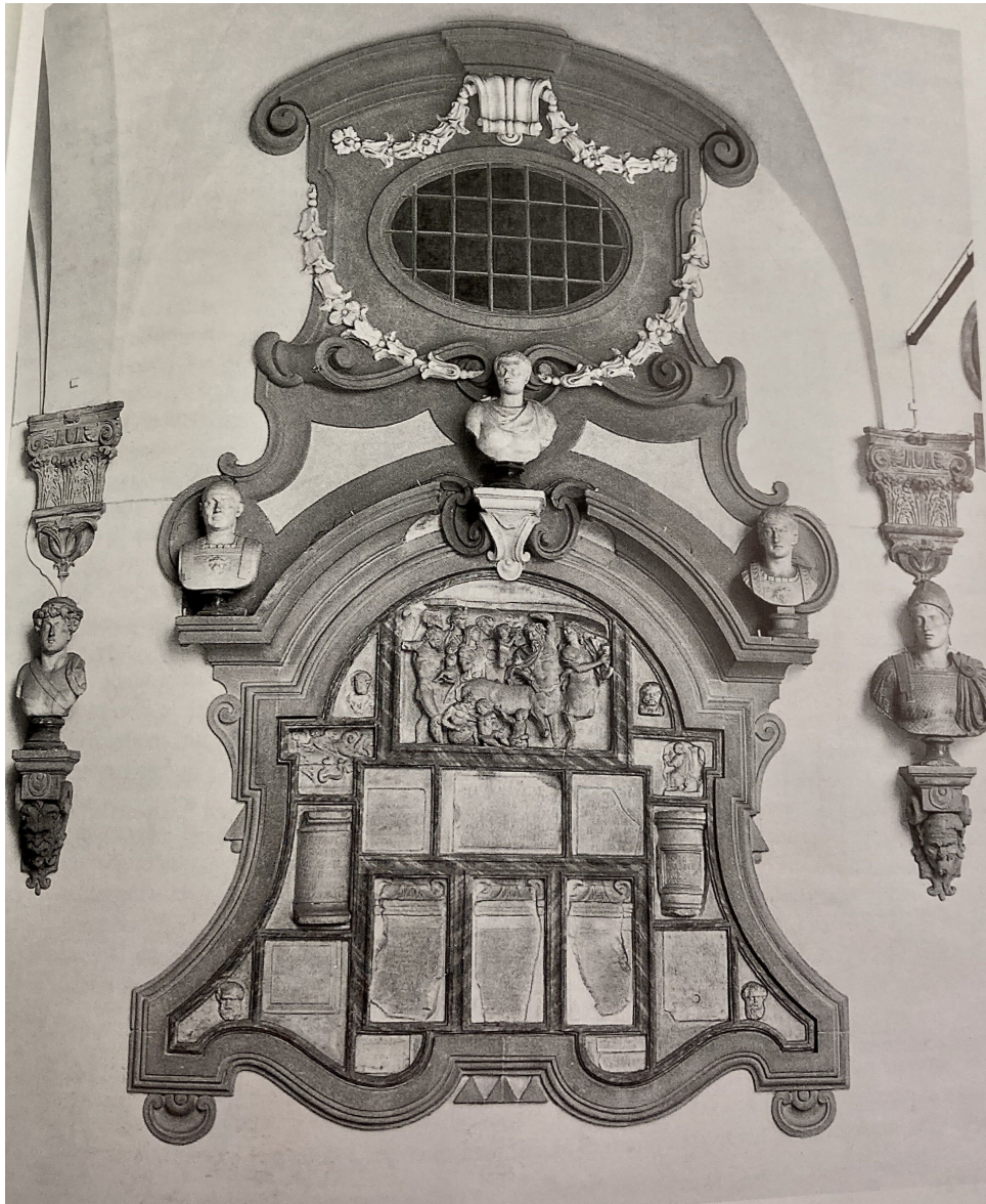
Fig. 10) Giovanni Battista Foggini, « Mostra » epigrafica, Firenze, Palazzo Medici Riccardi, cortile.