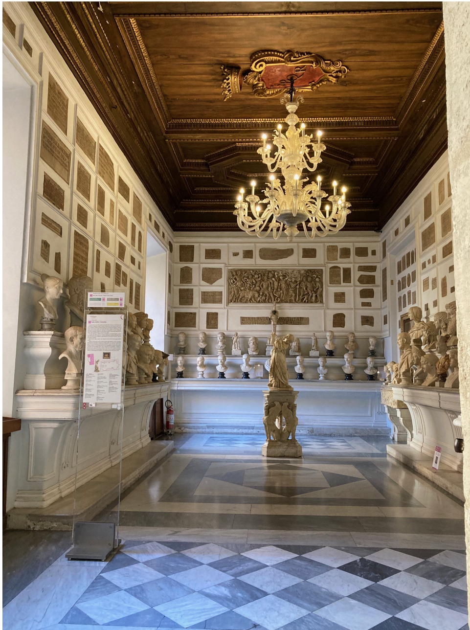
Fig. 13) Roma, Musei Capitolini, Palazzo Nuovo, antica « Stanza della Miscellanea », oggi Sala delle Colombe.