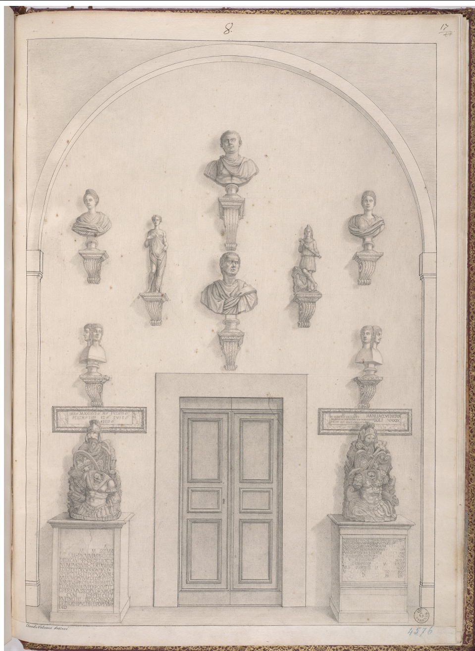
Fig. 7) Claudio Valvani Lorenese, Galleria degli Uffizi, Parete del Ricetto , Firenze, GDSU, inv. 4576 F.