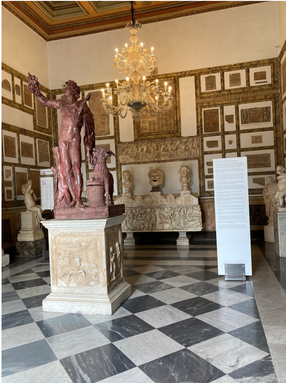
Fig. 14) Roma, Musei Capitolini, Palazzo Nuovo, Sala del Fauno.