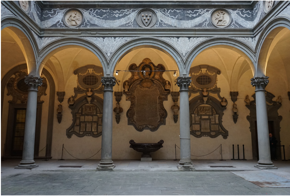
Fig. 9) Firenze, Palazzo Medici-Riccardi, cortile, ala meridionale.