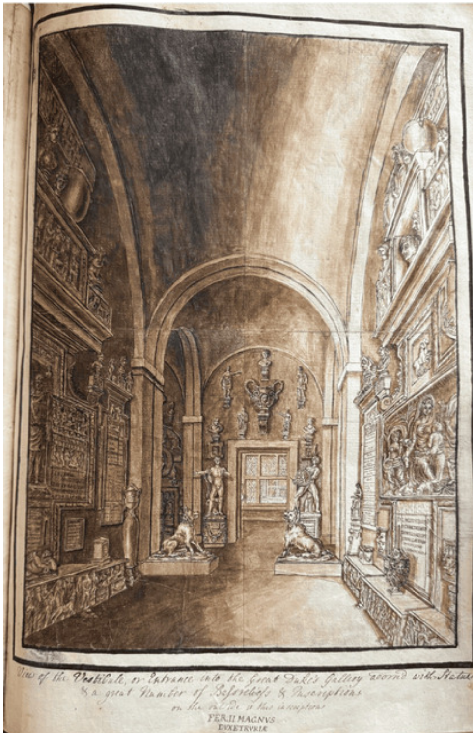
Fig. 1) Sir Roger Newdigate, Ricetto della Galleria degli Uffizi , 1739, Arbury Hall Estate, mss. CR 136/B 3519.