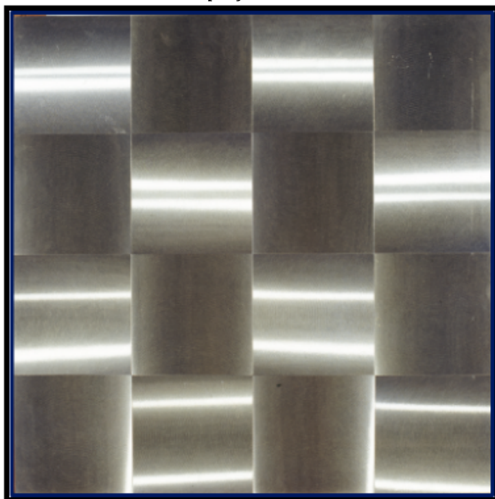
Figura 3 - Getullio Alviani, Superficie a tessitura vibratile