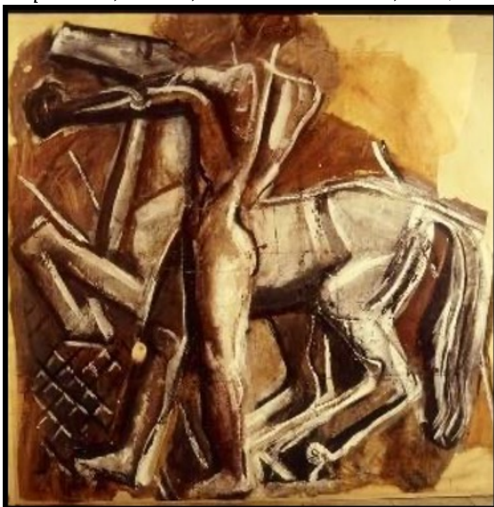
Figura 2 - Mario Sironi, La giovinezza - Uomo a cavallo (cm. 316x317x4 - Olio su carta intelata)